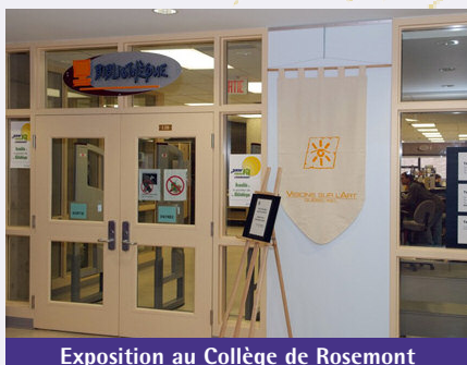
Exposition au Collège de Rosemont